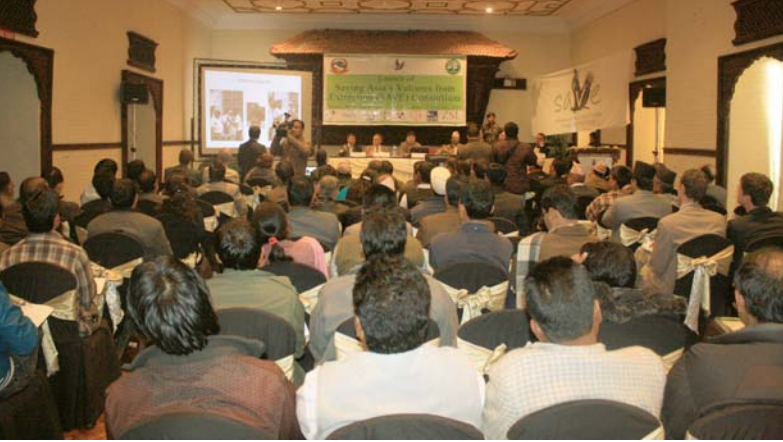
SAVE कार्यक्रमका सहभागीहरू

२२ फेब्रुवरीका दिन संविधान सभाका सभाध्यक्ष सम्माननीय सुवास नेम्वाङले गर्नु भयो। राष्ट्रिय निकुञ्ज तथा वन्यजन्तु संरक्षण विभाग, नेपाल पन्छी संरक्षण संघ, राष्ट्रिय प्रकृति संरक्षण कोष तथा बेलायतमा रहेका RSPB एवं ZSL लगायतका संस्थाहरूले यस रणनीतिलाई अगाडि बढाउँदैछन्। गिद्ध संरक्षणका लागि यस अघि नै नेपालको तराई क्षेत्रमा विश्वमा नै पहिलो गिद्ध संरक्षित क्षेत्र घोषणा गरिसकिएको छ। यस रणनीति अन्तर्गत विलुप्त हुन लागेका गिद्ध प्रजातिहरूको प्रजनन गराई तिनीहरूको संख्या बढाउँनु रहेको छ।