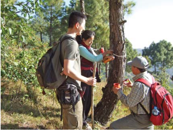
शिवपुरी नागार्जुन राष्ट्रिय निकुञ्जमा कार्वन सर्वे गर्ने

वनमा पर्यावरण सेवा मूल्याङ्कन पद्धतिका साधानहरू पहिलो पटक प्रयुक्त गरिएको छ। क्षेत्रगत कार्य जस्तै कार्वन, जङ्गलबाट जागरण गर्ने वस्तुहरू, पर्यटन तथा जलश्रोतको उपयोग उक्त दुवै वासस्थानमा शुरु गरिसकिएको छ।