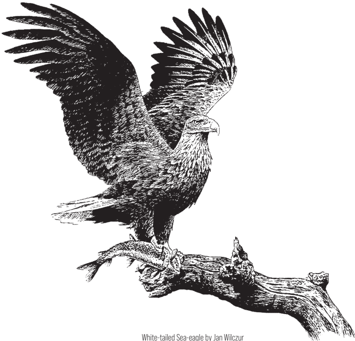
White-tailed Sea-eagle by Jan Wilczur

Birds of Nepal: An Official Checklist, Kathmandu, Nepal.